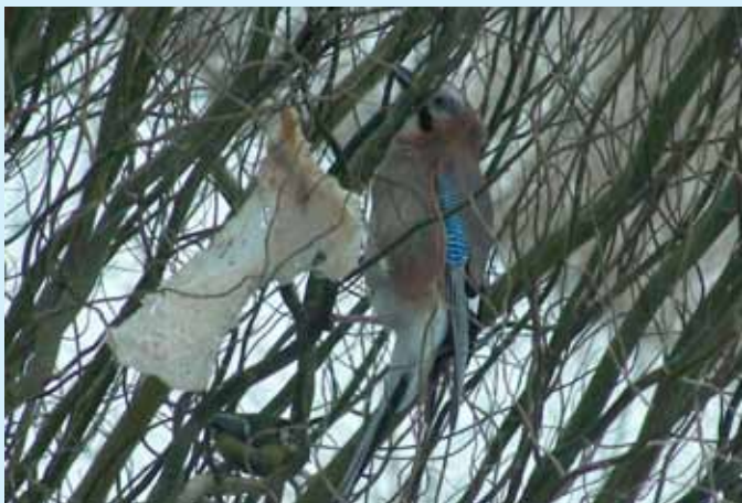
Ptasią stołówkę odwiedziła sójka.