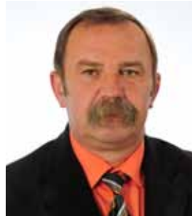
Jedyny nasz przedstawiciel w Radzie Powiatu w Radziejowie